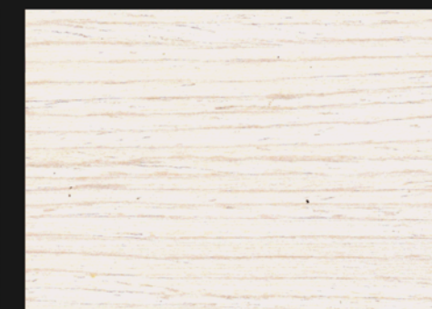
BIANCO CALCE 2