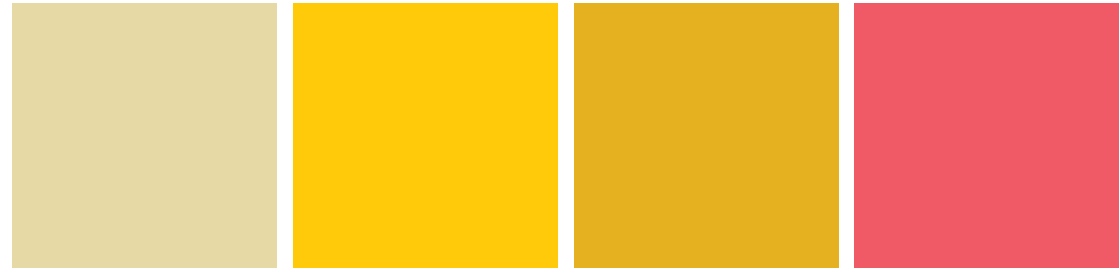
GRIGIO PERLA - D064